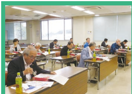
通常例会に戻り、久しぶりの昼食